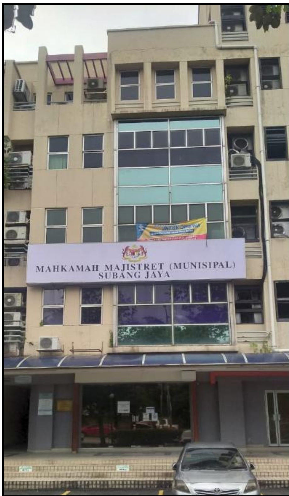
MAHKAMAH MAJISTERIT (MUNISIPAL), SS 15, SUBANG JAYA