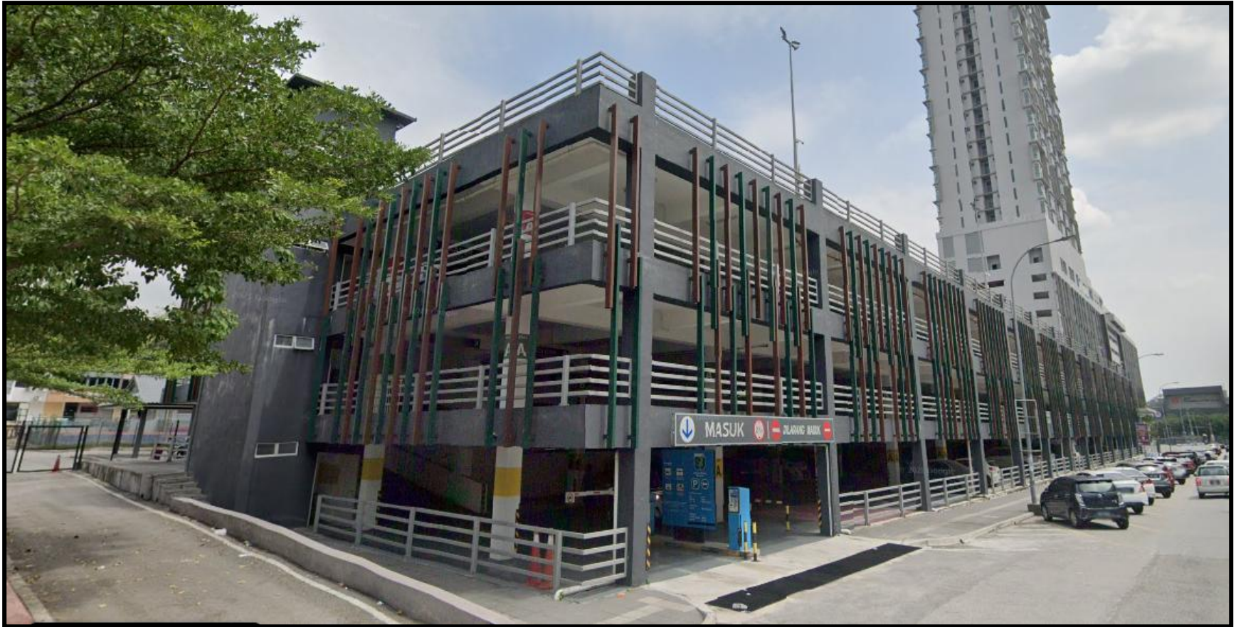
PEJABAT PENGURUSAN DAN TEMPAT LETAK KERETA BERTINGKAT, SS 15, SUBANG JAYA